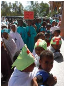
17 aprile Domenica delle Palme con rito ortodosso-copto a Mekanissa Addis Abeba.