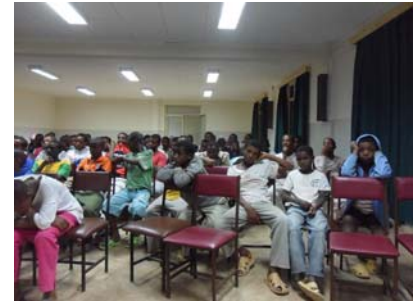
Ragazzi di strada nell'aula "Paolo Burloni" ,da noi finanziata, del Bosco Children.