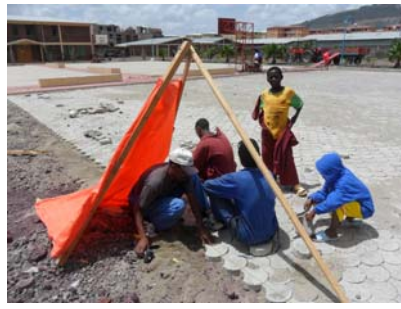
15 aprile Bosco Children ,struttura per l'accoglienza dei ragazzi di strada di Addis Abeba.