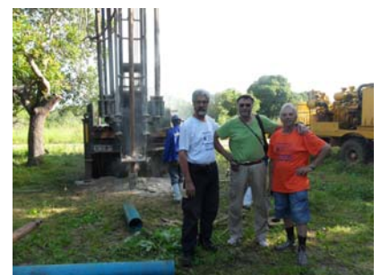
3 aprile Monapo progetto pozzo per associazione Watana.