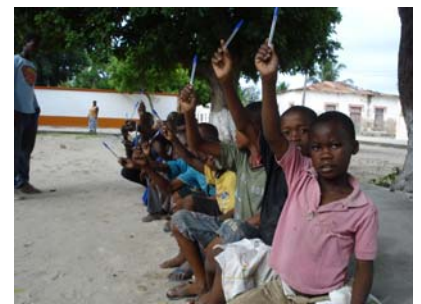
1 aprile Ilha de Mozambique ,una penna per tutti !!!!!