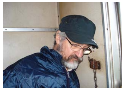
Ciapa el nono.....