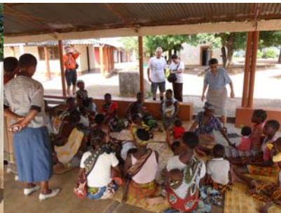
24 marzo visita al "Centro Nutricional J. Allamano" di Cuamba Mozambico retto da suore brasiliane Missionarie della Consolata.

26 marzo Orfanotrofio "Casa de Alegria" delle Missionaries da Caridade (Madre Teresa di Calcutta) Nampula Mozambico