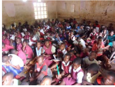
21 marzo Nkhotakota Malawi missione salesiana progetto scuola e pozzo.