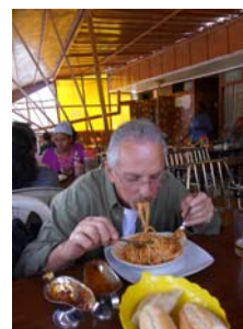
Spaghetti abissini m'avete provocato e mo' ve magno!!!!