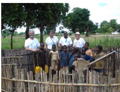
2 aprile Monapo contatto con l'associazione locale mozambicana WATANA esempio di impegno e competenza dei volontari formati in Italia.