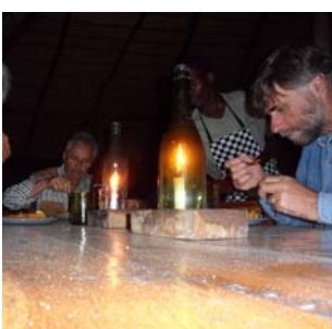
Cena a lume di candela.