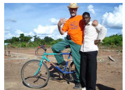
Ecco le biciclette del nostro progetto "BIKES FOR AFRICA" nella missione dei Missionarios da Sagrada Familia a Mecuburi Nampula Mozambico.